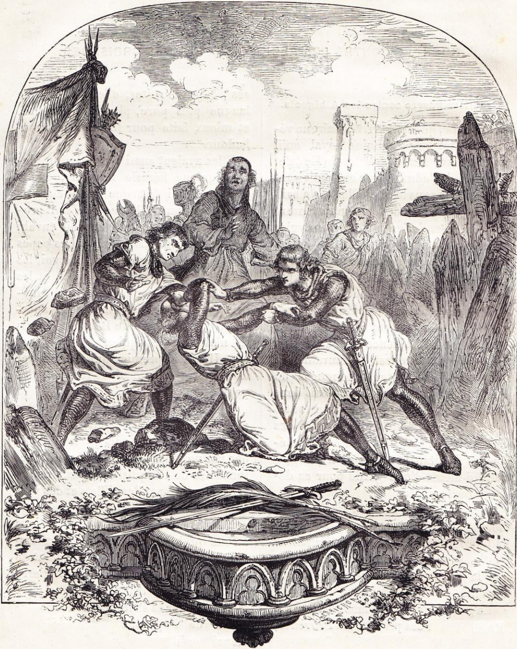
Mort de Simon de Montfort, (1218.)