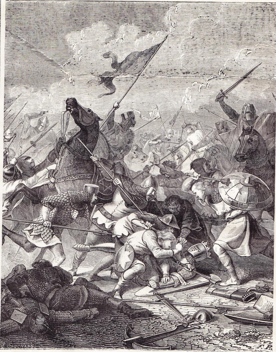
Bataille de Bouvines. (1214.)